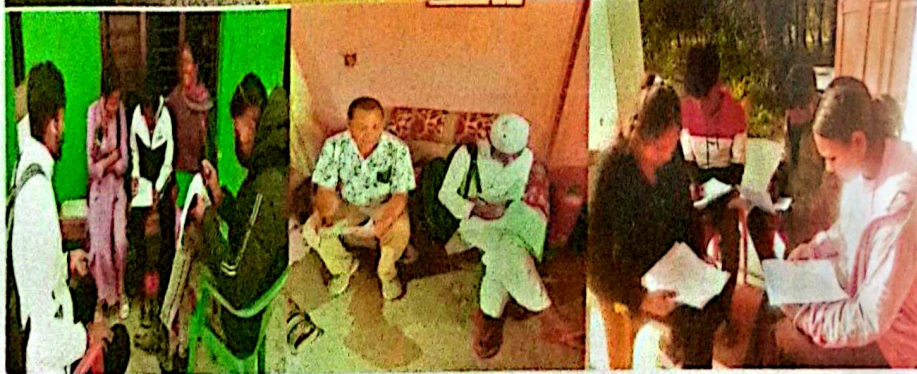
सुनसरीको इनरुवा नगरपालिका ९ नम्बर वडामा सर्वे गर्दै गरेको तस्विर