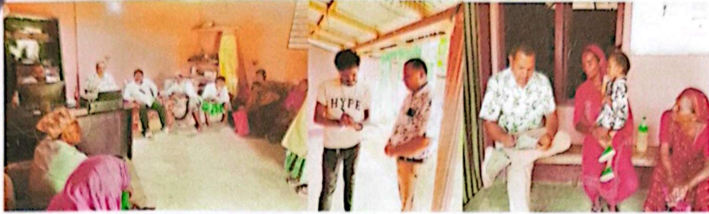
सुनसरीको इनरुवा नगरपालिका १० नम्बर वडामा सर्वे गर्दै गरेको तस्विर